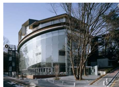
野依記念学術交流館

なお今回は東海 4 県農業関係試験研究機関、第 24 回アジア農科系大学連合 (AAACU) 会議 (12 月 2 日—4 日：有料) との共催になります。